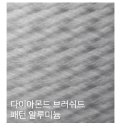
다이아몬드 브러쉬드 패턴 알루미늄

※ 엠버전트 무드램프는 대표 컬러 10종과 개별 설정 가능한 64색이 적용됩니다. 선택한 내장 컬러와 설정한 조명 컬러에 따라 일부 환경에서는 다른 색으로 보여질 수도 있습니다.