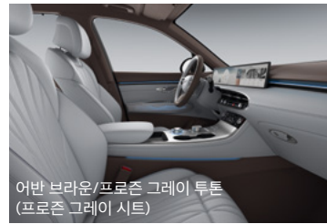
어반 브라운/프로즌 그레이 투톤 (프로즌 그레이 시트)