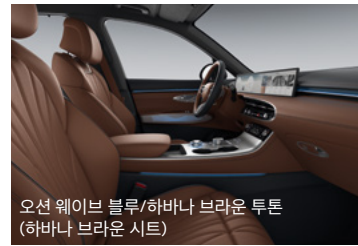
오션 웨이브 블루/하바나 브라운 투톤 (하바나 브라운 시트)