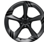
21인치 다크 메탈릭 글로시 그레이 + 블랙 패드 프린팅 휠 *스포츠 전용