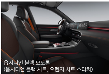
옵시디언 블랙 모노톤 (옵시디언 블랙 시트, 오렌지 시트 스티치)