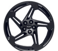
21인치 매트블랙 경량화 단조 휠 *스포츠 전용(제네시스 엑세서리)