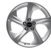
19인치 다크 하이퍼 실버 휠