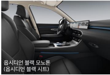
옵시디언 블랙 모노톤 (옵시디언 블랙 시트)

* 시그니처 디자인 셀렉션 I 어반 브라운/프로즌 그레이 투톤 컬러는 '24년 6월 이후 출고 가능합니다.