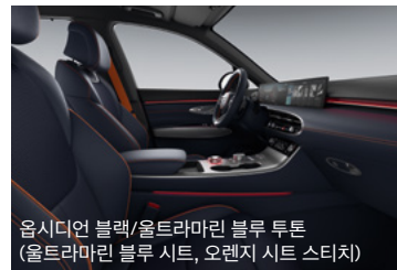
옵시디언 블랙/울트라마린 블루 투톤 (울트라마린 블루 시트, 오렌지 시트 스티치)