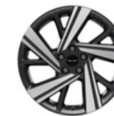
19인치 다크 메탈릭 글로시 그레이 휠 *스포츠 전용