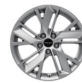
18인치 리얼 스틸 그레이 휠