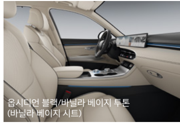
옵시디언 블랙/바닐라 베이지 투톤 (바닐라 베이지 시트)