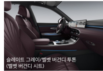
슬레이트 그레이/벨벳 버건디 투톤 (벨벳 버건디 시트)