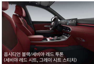
옵시디언 블랙/세비아 레드 투톤 (세비아 레드 시트, 그레이 시트 스티치)