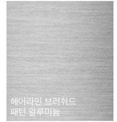
헤어라인 브러쉬드 패턴 알루미늄