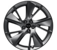
21인치 다크 스피어링 휠