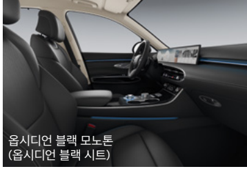
옵시디언 블랙 모노톤 (옵시디언 블랙 시트)