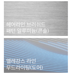
헤어라인 브러쉬드 패턴 알루미늄(콘솔)